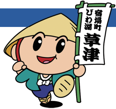
草津市公認マスコット キャラクター「たび丸」